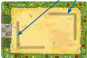
Front: easy variation