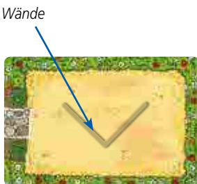
Rückseite: Variante für fortgeschrittene Stapel-Helden