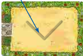
Back: variation for expert stacking heroes