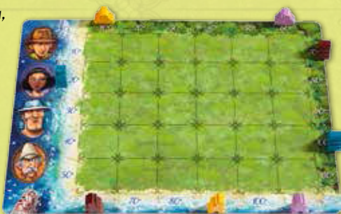
Ejemplo de disposición de la isla antes de empezar el juego.

A Luis le queda el aventurero marrón; lo coloca en los 60 grados de la playa y elige los 70 grados de la jungla para situar allí el templo del mismo color. Una vez más, el resto de jugadores toma las mismas posiciones.